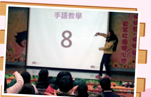
參加者用心地學習手語，認識聽障人士的溝通方式。