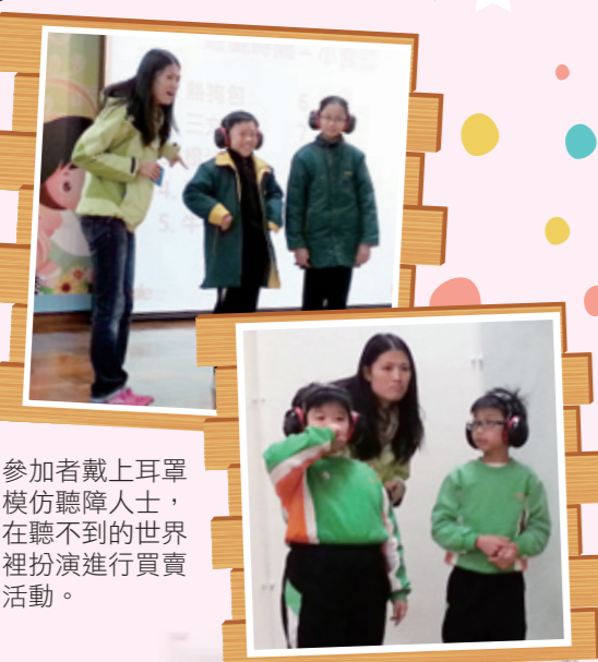
參加者戴上耳罩模仿聽障人士，在聽不到的世界裡扮演進行買賣活動。

為了讓同學學會尊重差異和欣賞殘疾人士的才能，共建無障礙的社會，本會於2014年1月18日(星期六)邀請了本港機構「黑暗對話」到校舉辦一項名為「傷健共融，各展所長」的親子活動。當天共有44位家長出席，他們從學習手語及扮演聽障人士買小食等活動，親身體驗聽障人士的生活。參加者都表示學習手語很有趣，而且能多了解聽障人士的生活，擴闊自己的視野。