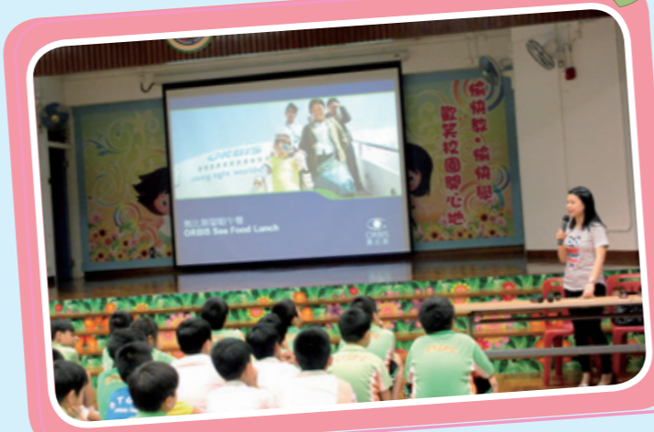
活動後，奧比斯機構職員隨即為全體小四學生舉行護眼講座。