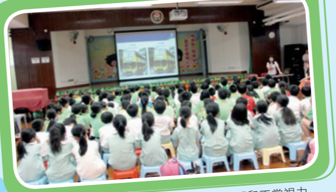
講座中，同學們可認識到有視障問題和正常視力的人所看見物件的分別，真是獲益良多。