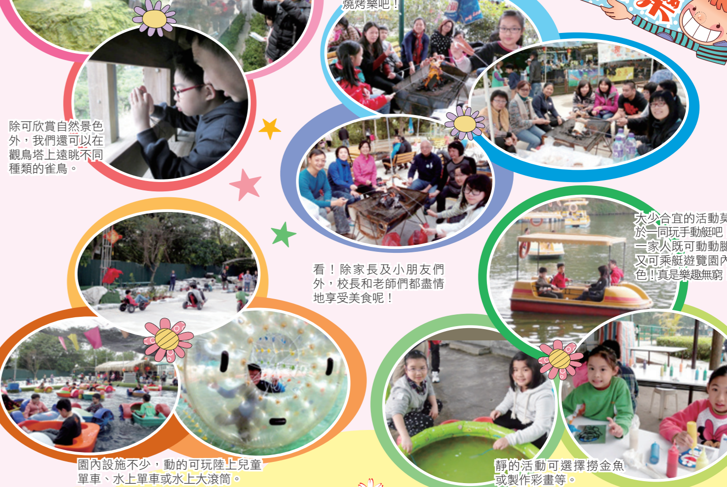
太少合宜的活動莫過於一同玩手動艇吧！一家人既可動動腿，又可乘艇遊覽園內景色！真是樂趣無窮！