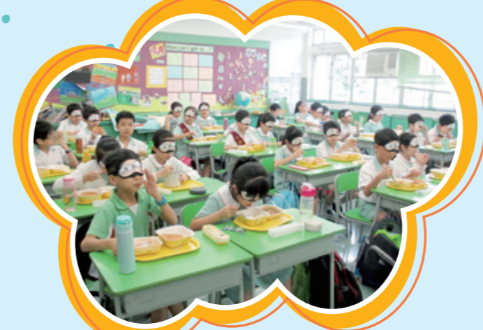
進行蒙眼午餐時，各同學均認真地體驗視障人士吃飯時的感受。