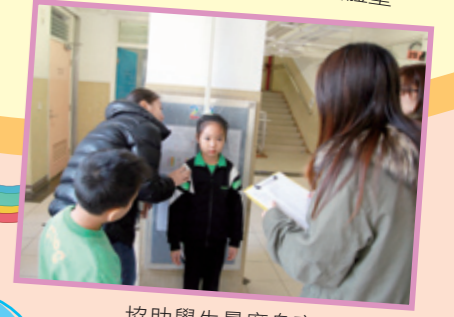
協助學生量度身高