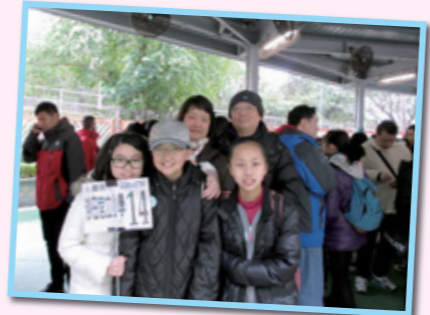
當天集合時，天氣不佳，還下起雨來，但無損我們愉快的心情。