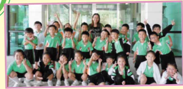
協助帶隊參觀兒童探知館