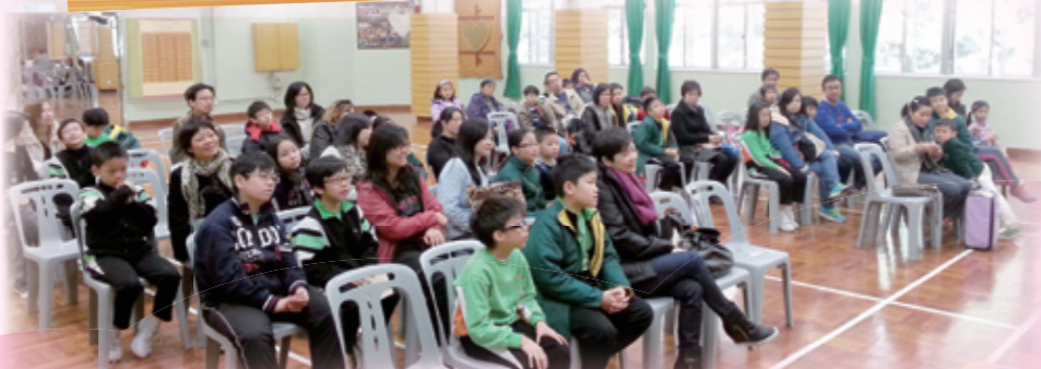
參加者都專心地聆聽講者分享有關聽障人士在生活中所遇到的事情。