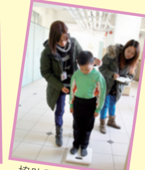
協助學生量度體重