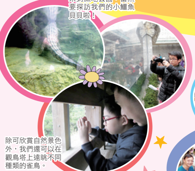
來到濕地公園，當然要探訪我們的小鱷魚貝貝啦!!