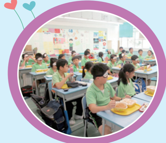
進行蒙眼午餐前，同學都專心地聆聽老師的講解，明白進行蒙眼午餐時的進食技巧和注意事項。