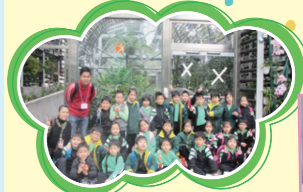
協助帶隊參觀香港動植物園

家長義工隊全年無休地支援學校的活動進行。他們既穿梭於校舍的各個樓層，協助學生量度身高及體重，又全力協助領隊的老師，照顧外出參觀的同學。