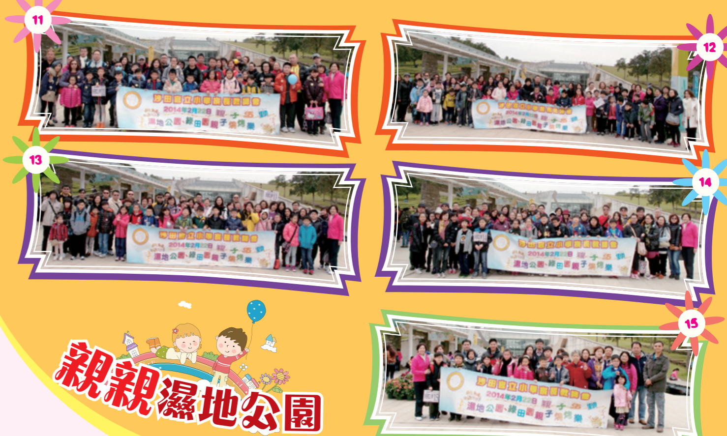
各車於濕地公園門前拍照留念。