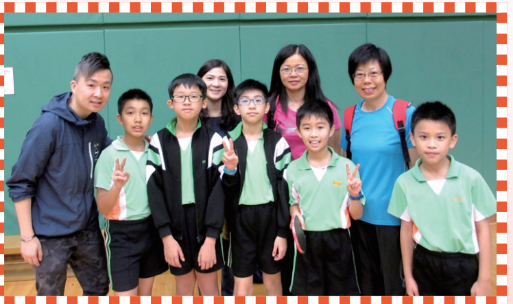
首先參加學界比賽的是乒乓球校隊，他們在教練及家長義工的帶領下出席了比賽，全力以赴，專心作賽。

學校為同學安排了多項的體育項目訓練，無論是戶內的，或是戶外的，同學都努力練習，以期在比賽中取得好成績。