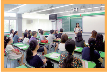
班主任向家長報告學校關注事項及簡述班務安排

本年度家長教師座談會已於26-9-2015（星期六）舉行，我們很高興各位家長於百忙中抽空出席座談會，讓我們感受到家長對學校的支持及對子女的關愛。當天由班主任老師向家長簡介本年度的關注事項，然後由中、英、數科任老師詳盡地講解各科的科務事宜及與家長進行討論，透過彼此的交流，積極發揮家校合作的精神，為孩子提供更適切的學習服務。