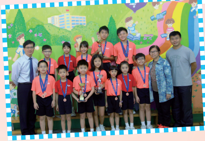
在十一月期間，壁球校隊及田徑校隊也代表學校參加校際比賽，取得非常優異的成績，在此恭喜各同學在努力練習後，取得滿意的成果。