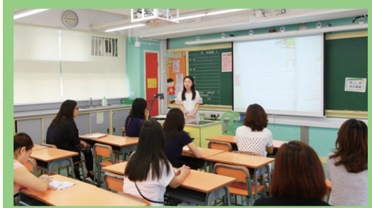
家長聚精會神地聆聽中、英、數科任老師講解各科的教學要求及需要家長配合的事項。