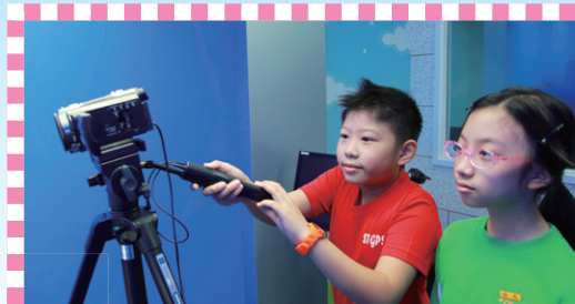
「校園小记者」正進行攝錄工作，態度認真投入。