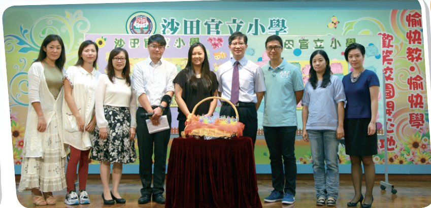
校長及兩位副校長接受家教會致送的敬師日禮物