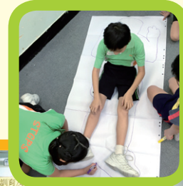
如何去猜透同學的身體語言呢？