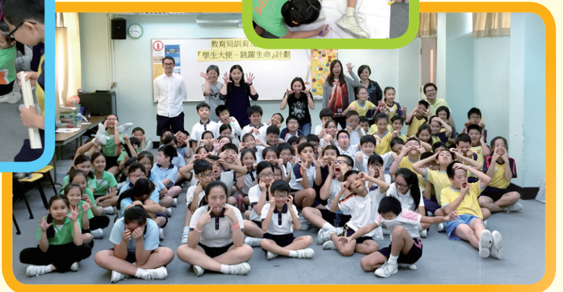
學生大使肩負起「自我超越、自我問責」的精神。