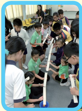
同學們不要躲懶，努力才有成果啊！