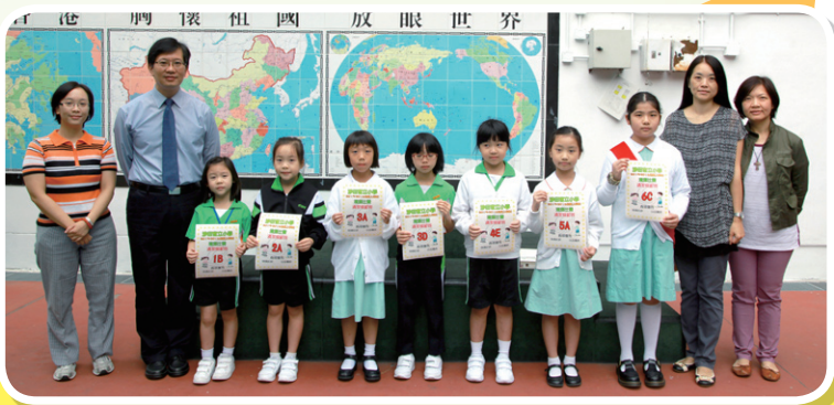
能獲得「清潔模範班」的榮譽，肯定是全校同學的好榜樣。