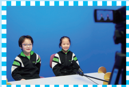
同學們在校園電視台進行現場直播，表現令人欣賞。