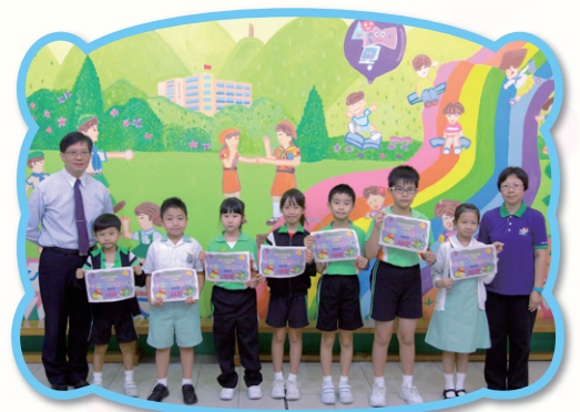
曾校長頒發優異獎狀給各班代表。