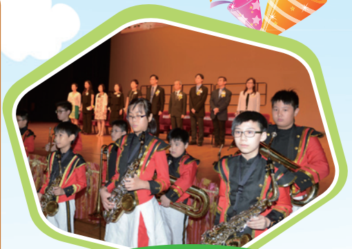
本校銀樂隊率先帶領嘉賓進場及台上就座。

畢業禮在一片溫馨及感人的氣氛下結束了，同學告別小學階段，還有更遠的路要走，期盼他們懷着校長、老師及同學們的祝福，昂首踏上中學康莊之路。