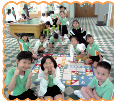
三年級同學們懷著愉快的心情到「兒童探知館」參觀，認識一下香港曾流行的童玩遊戲，感到既新奇又有趣。