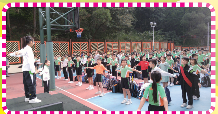
高年級同學做早操情況。