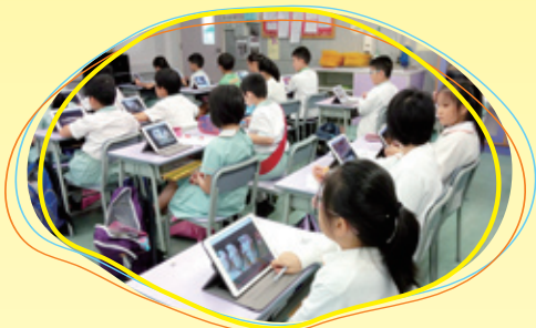
同學聚精會神學習使用平板電腦。

本年度以小三、小四常識科及小四數學科為試點，運用電子學習資源進行多元化學習，建設以學生為中心的自主學習環境，進行互動學習活動，優化課堂教學。此外，全校已在電腦科使用電子書，以配合電子學習的發展。