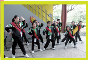
野外定向：各組員在限時內同心合力完成不同的任務：砌圖形、齊扮火柴人、尋彩磚……各組員十分投入，也發揮團隊合作精神完成任務。