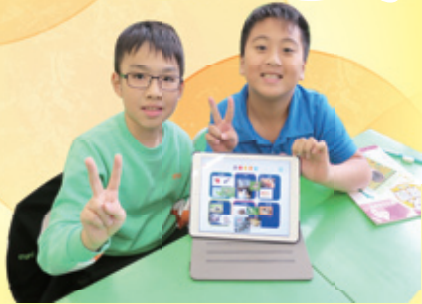
同學正在利用平板電腦進行動物的分類活動。

電子學習能拓展學習的深度和廣度，提升學生的學習動機與成效，因此本校參加了「電子學習學校支援計劃」，致力發展電子學習，讓學生在課堂上通過使用平板電腦進行電子學習，增加師生的互動，提升學習動機，促進學生自主學習。