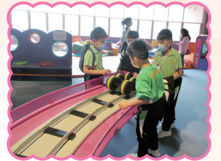
四年級同學來到香港科學館，一邊聆聽導賞員的介紹，一邊觀察科學展品，從體驗中學習科學原理。