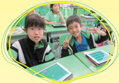
學生應用電子科技，在課堂中學習知識，真是輕鬆又愉快！