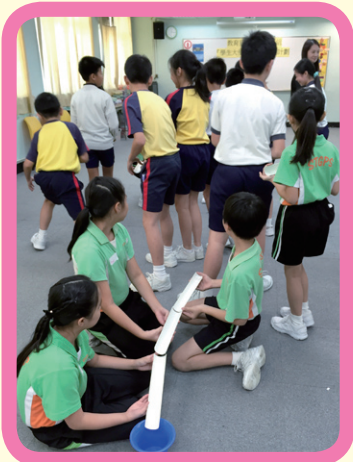
【水到渠成】-讓組員經歷衝突及實踐處理衝突的步驟-

十位學生大使在十月三十日接受領袖訓練課程，學習團隊精神、創意溝通、策劃能力和解難能力，透過「人與自己」、「人與他人」、「人與社會」三個演繹階段，以「愛自己、愛別人、愛校園、愛社區」四個發展重點，由個人至家人至友儕至社區，認識及接納自己的特質，全方位發揮自己的潛能，以積極的態度去掌握各種資訊及技巧，在校園內協助學校推行活動。