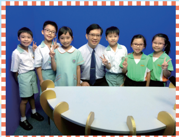
校長和同學們在「午間加油站」時段來個大合照。看，他們多高興啊！

校園電視台除了製作不同類型的節目外，本學年更增設「午間加油站」，每逢星期三午膳時段，校長和老師們會透過校園電視台的「沙小台」頻道進行直播，向全校學生加強價值教育，培育他們正向品格發展，建立積極的生活態度及正面的人生價值觀。