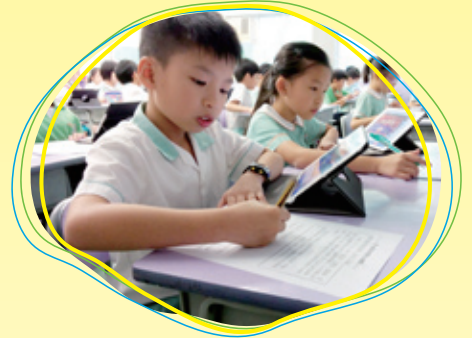
利用平板電腦，學生可按自己的進度學習。