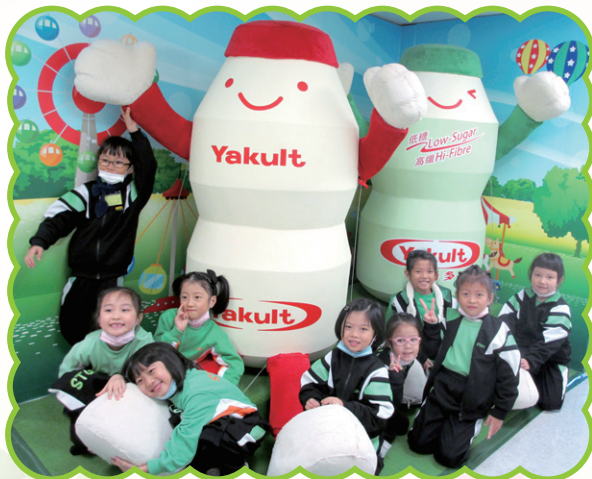
一年級同學們參觀益力多有限公司時，用心聆聽導賞員的介紹及踴躍回答問題。