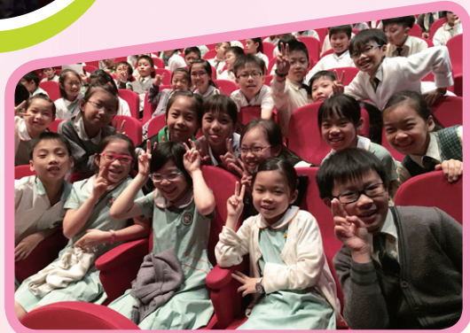
同學們興奮地等待音樂會開始!