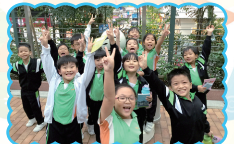
三年級同學參觀衛生教育展覽及資料中心，中心內有很多新穎有趣的互動遊戲，增強學習的趣味，真是寓學於樂，一舉兩得了！