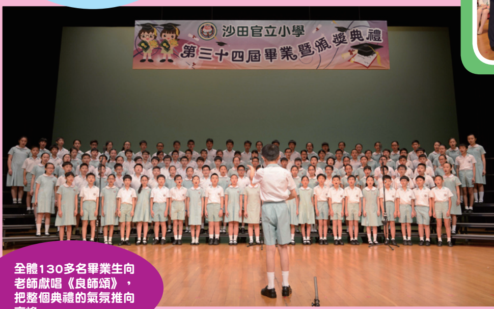
全體130多名畢業生向老師獻唱《良師頌》，把整個典禮的氣氛推向高峰