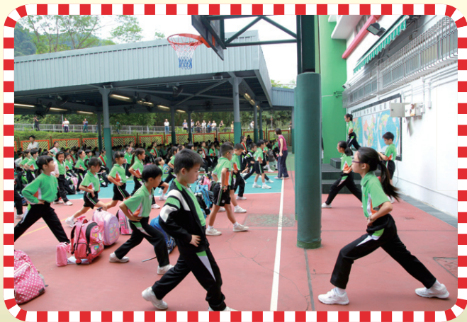
低年級同學做早操情況。