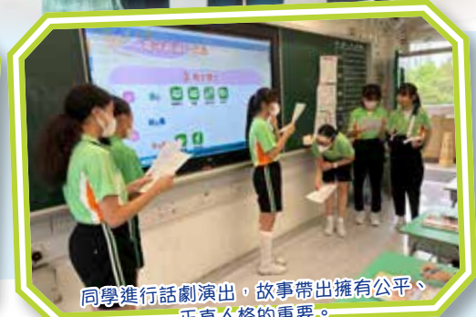
同學進行話劇演出，故事帶出擁有公平、正直人格的重要。