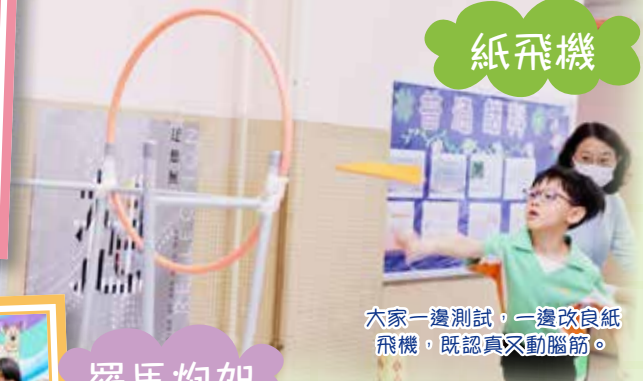
大家一邊測試，一邊改良紙飛機，既認真又動腦筋。