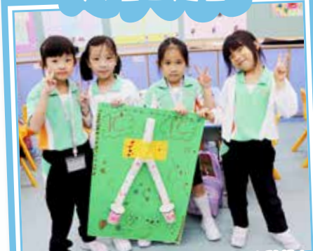
同學們有商有量地分工合作，份外有默契！