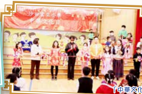
「中華文化日」開幕儀式