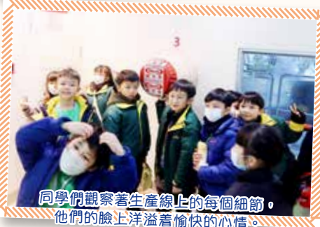
同學們觀察著生產線上的每個細節，他們的臉上洋溢着愉快的心情。