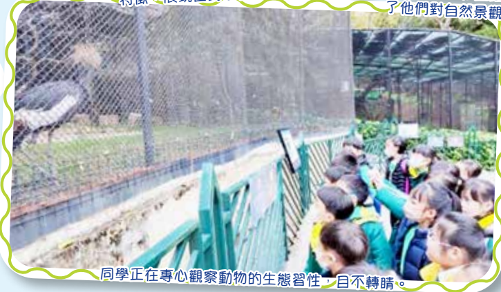
同學正在專心觀察動物的生態習性，目不轉睛。