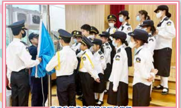
香港升旗總會到校培訓升旗隊