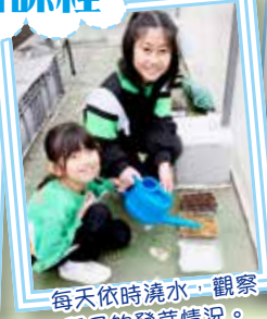
每天依時澆水，觀察種子的發芽情況。