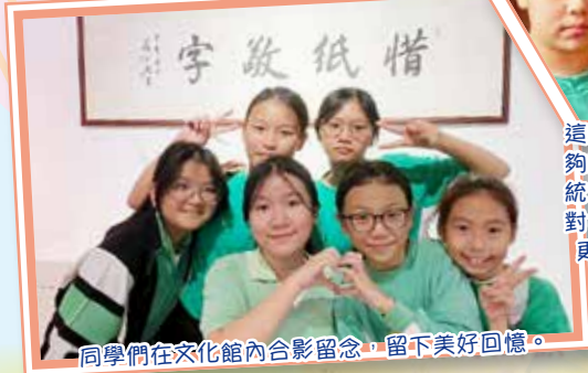
同學們在文化館內合影留念，留下美好回憶。