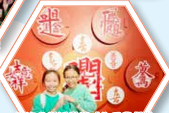
這次參觀活動將成為同學們難忘的經歷，也為他們打開了一扇通往文化世界的大門。