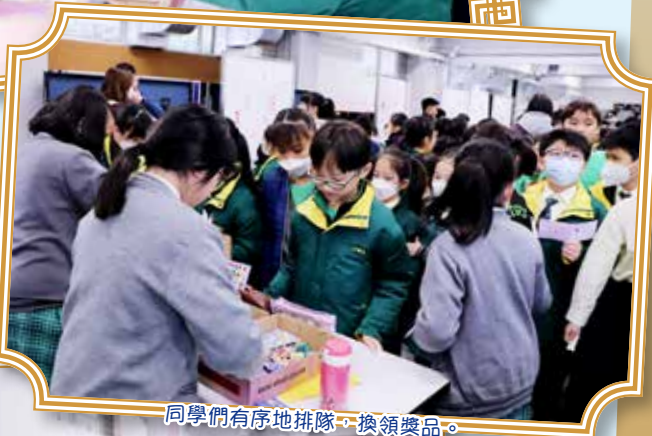
同學們有序地排隊，換領獎品。