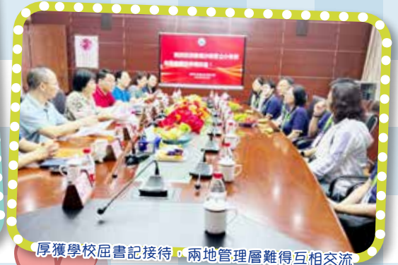
厚獲學校屈書記接待，兩地管理層難得互相交流