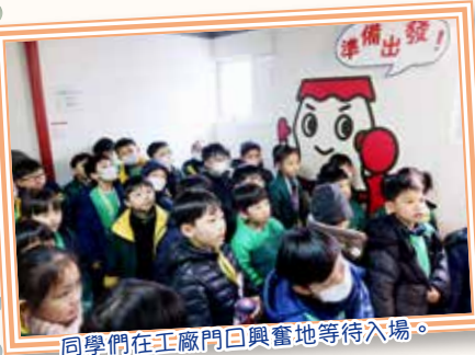
同學們在工廠門口興奮地等待入場。