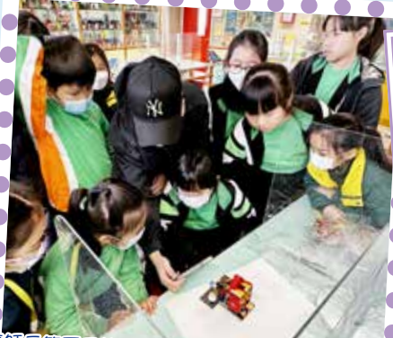
導師示範不同的攝影角度和技巧。學生們獲益良多。