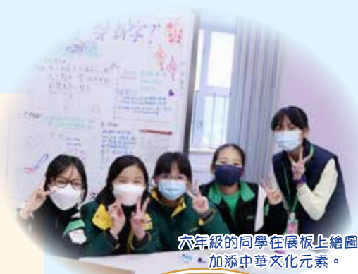
六年級的同學在展板上繪圖，加添中華文化元素。