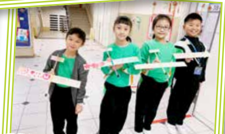
同學們互相比試，看誰的滑翔機設計飛得最遠!