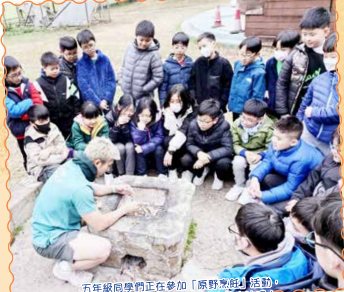
五年級同學們正在參加「原野烹飪」活動，他們很留心聆聽導師講解生火的方法呢！

五年級及六年學生分別於一月及五月參加了以「互助友愛闖難關」為主題的戶外教育營，地點為香港中華基督教青年會烏溪沙青年新村。此營地擁有優良的大自然環境及完善的設施，學生在體驗戶外學習之餘，亦透過歷奇活動、紀律、團隊及其他的訓練，學習及提升個人管理、溝通協作、解難及抵抗逆境的能力。此外希望藉着團體生活，鼓勵學生互相照顧，發揮團隊精神。教育營的活動豐富多采，除了有講求解難協作的歷奇活動外，還有為同學們帶來新體驗的「原野烹飪」。晚上更有晚會同樂，讓同學們進行集體康樂活動或才藝表演，增進友誼。