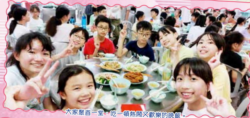
大家聚首一堂，吃一頓熱鬧又歡樂的晚飯。