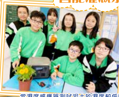
當濕度感應器測試泥土的濕度較低時，系統就發揮功能進行灌溉。