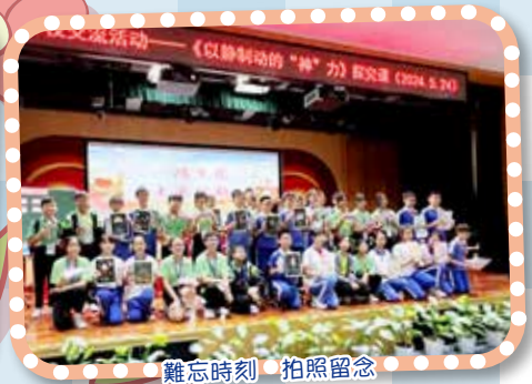
難忘時刻 拍照留念