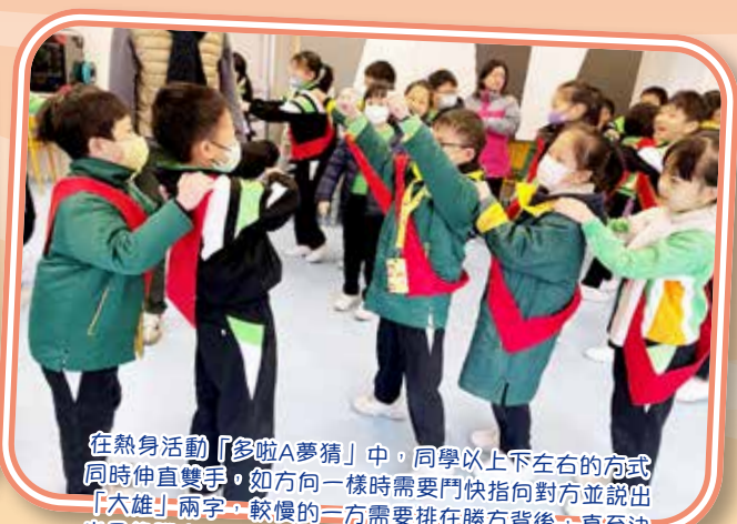
在熱身活動「多啦A夢猜」中，同學以上下左右的方式同時伸直雙手，如方向一樣時需要鬥快指向對方並說出「大雄」兩字，較慢的一方需要排在勝方背後，直至決出最後勝出者。這活動考驗了同學們的反應和合作性。