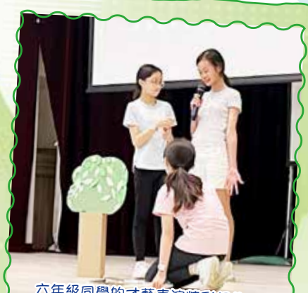
六年級同學的才藝表演精彩絕倫，台下同學報上熱烈的掌聲。