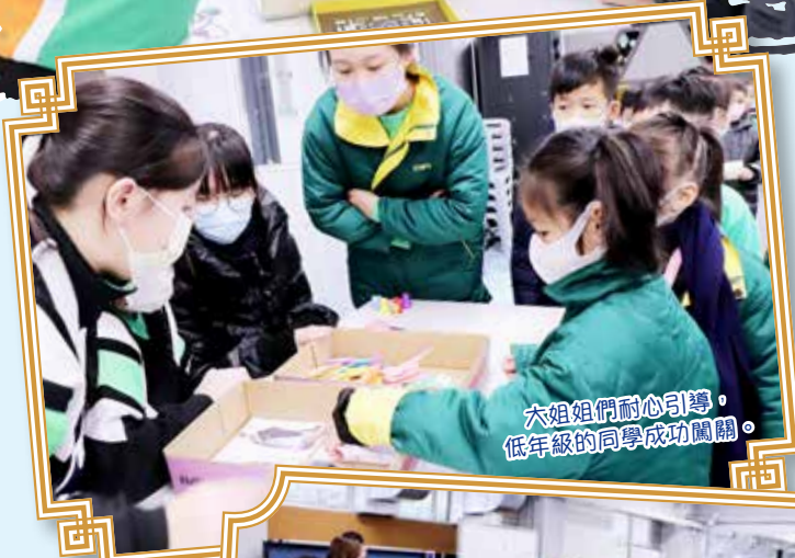
大姐姐們耐心引導，低年級的同學成功闖關。