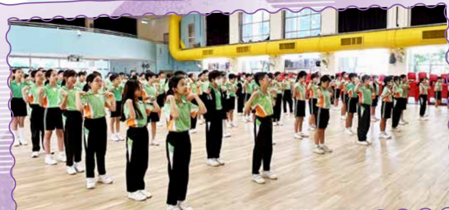
早上起來做早操，活力強健身體好！