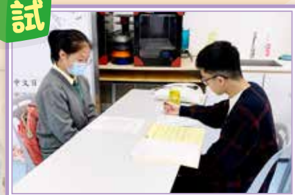
校友們在百忙中抽空到來擔任導師指導學弟學妹。