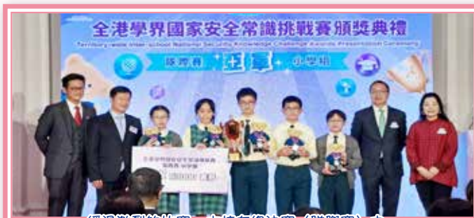
經過激烈的比賽，本校在總決賽（隊際賽）中榮獲亞軍殊榮。