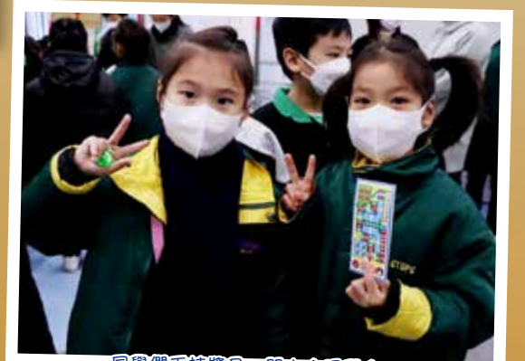
同學們手持獎品，開心合照留念。