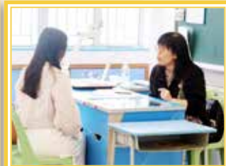
家長出席家長日領取成績表，並了解子女的表現。