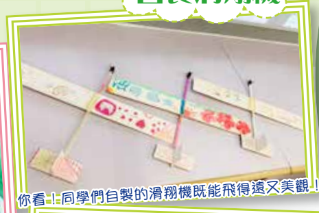
你看!同學們自製的滑翔機既能飛得遠又美觀!