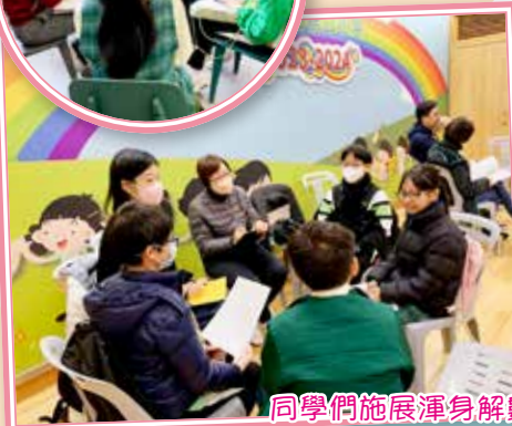
同學們施展渾身解數，積極地發表意見。