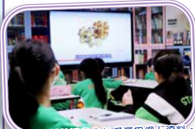
圖書館主任教導學生如何運用網上資料。

閱讀不同主題和體裁的書本，可以讓學生接觸到各種不同的知識領域，有助於培養學生的閱讀技巧，跨學科學習鼓勵學生在不同學科之間建立聯繫，可以培養學生的批判性思維和解決問題的能力，更能夠激發同學的創造力，當接觸到不同學科의思想和概念時，會開始思考它們之間的聯繫，並可能會產生全新的想法。