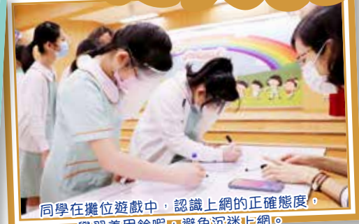
同學在攤位遊戲中，認識上網的正確態度，學習善用餘暇，避免沉迷上網。