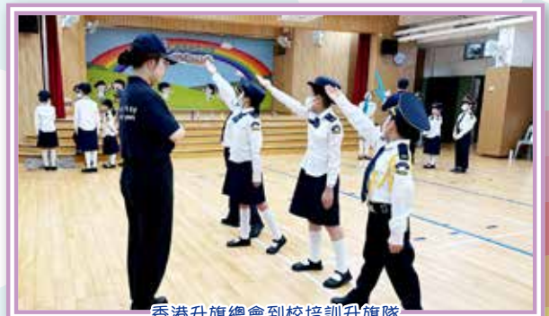
香港升旗總會到校培訓升旗隊