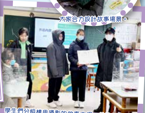
學生們分組構思攝影的故事大綱，並進行匯報。