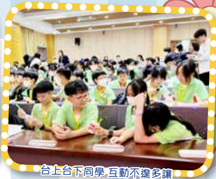
台上台下同學 互動不遑多讓