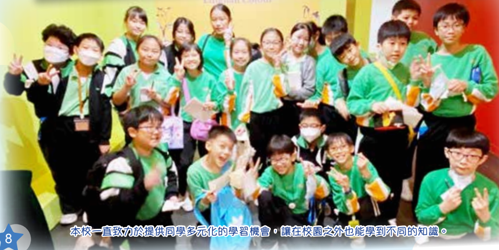
本校一直致力於提供同學多元化的學習機會，讓在校園之外也能學到不同的知識。