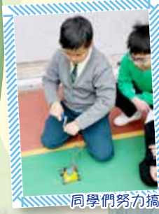
同學們努力搞動發電機為電容車儲電。