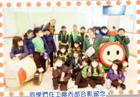
同學們在工廠內部合影留念。