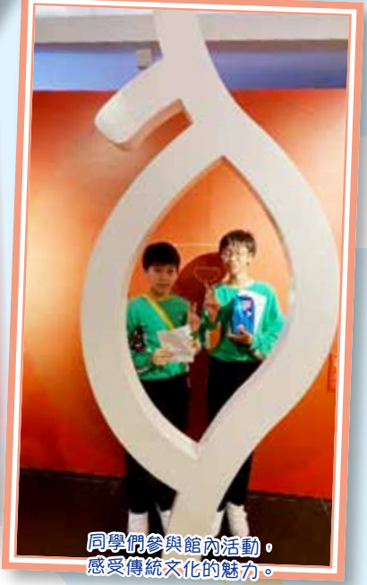
同學們參與館內活動，感受傳統文化的魅力。