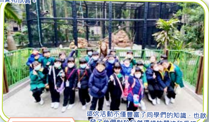
這次活動不僅豐富了同學們的知識，也啟發了他們對於自然環境的關注和愛護。