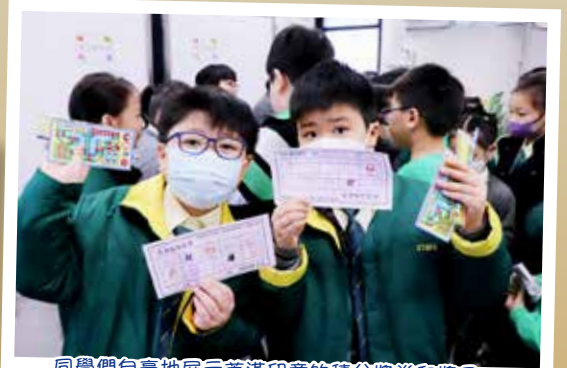
同學們自豪地展示蓋滿印章的積分獎券和獎品。