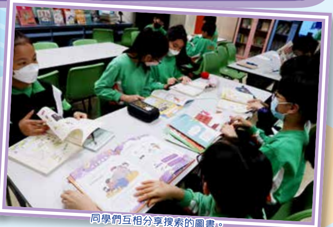
同學們互相分享搜索的圖書。