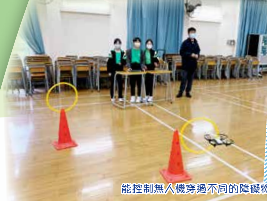
能控制無人機穿過不同的障礙物，蠻有滿足感呢！