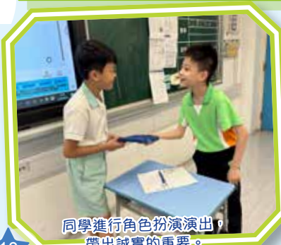
同學進行角色扮演演出，帶出誠實的重要。