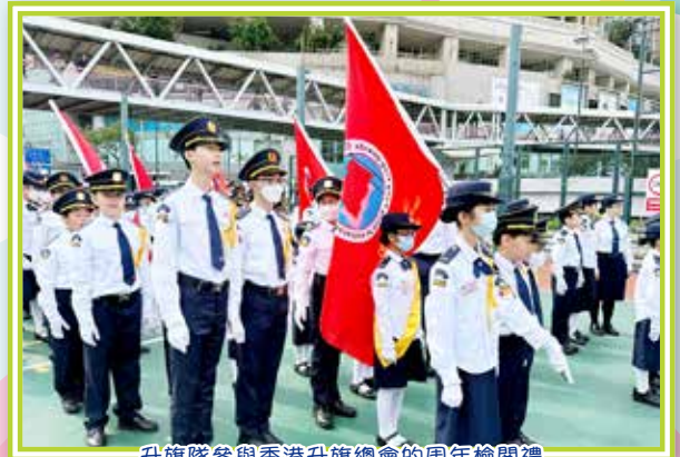
升旗隊參與香港升旗總會的周年檢閱禮