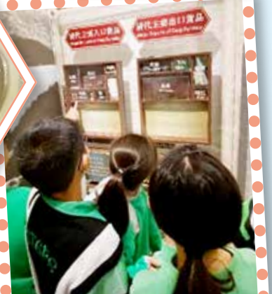
同學們觀賞展覽中的文物和藝術品，學習中華文化知識。