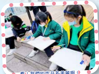
看！我們的作品多美麗啊！