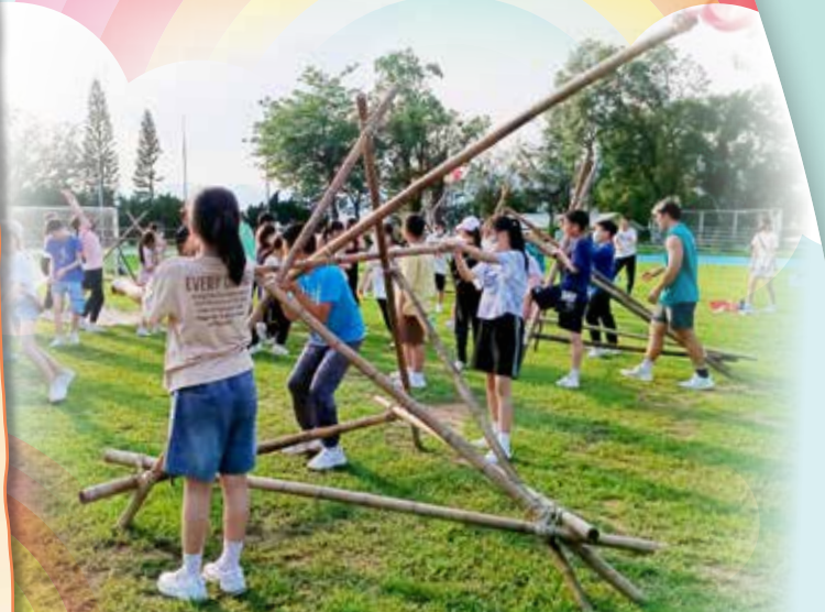
六年級同學們在大草地上製作「羅馬炮台」，一切準備就緒，等待發射！