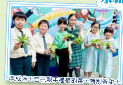
收成啦!自己親手種植的菜，特別香甜!