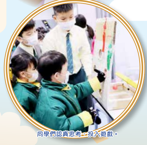
同學們認真思考，投入遊戲。