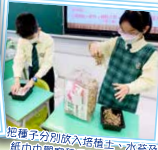
把種子分別放入培植土、水苔及紙巾中觀察種子發芽的分別。