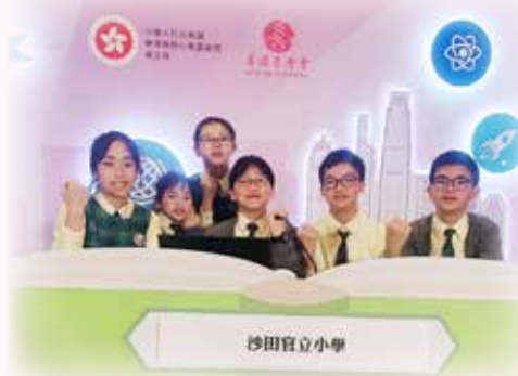
在比賽前，參賽同學互相打氣，展現了團隊合作的精神，為比賽增添了更多的正能量。