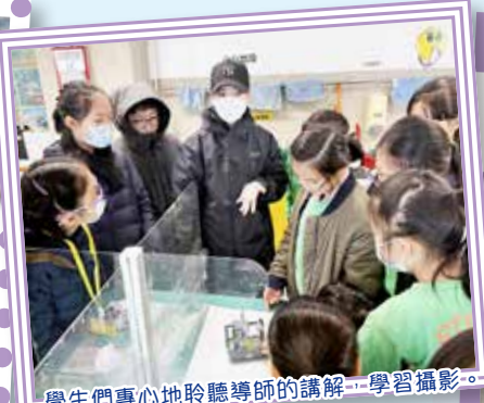
學生們專心地聆聽導師的講解——學習攝影。