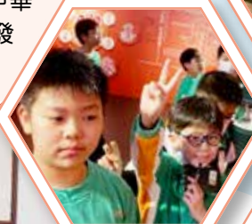
同學們在饒宗頤文化館內與展品互動，增進對文化的理解。

本校安排五年級同學參觀饒宗頤文化館，為同學們帶來了一個豐富的中華文化體驗，擴展了他們的視野，啟發了他們對中華文化傳承的興趣。