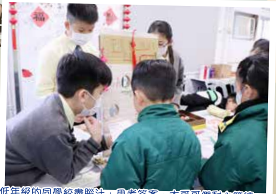
低年級的同學絞盡腦汁，思考答案，大哥哥們耐心等待。