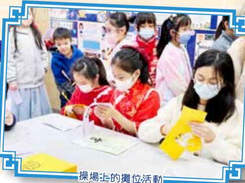
操場上的攤位活動