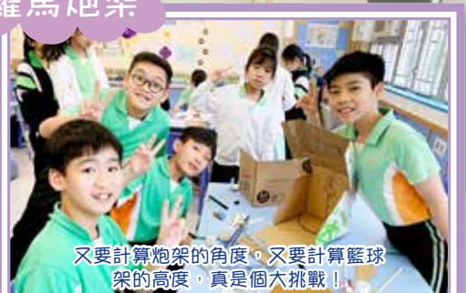
又要計算炮架的角度，又要計算籃球架的高度，真是個大挑戰！