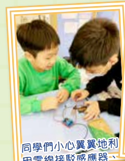
同學們小心翼翼地利用電線接駁感應器、處理器及繼電器。