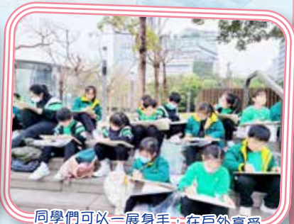
同學們可以一展身手，在戶外享受寫生活動。