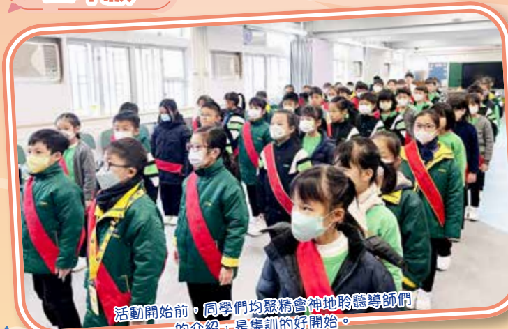
活動開始前，同學們均聚精會神地聆聽導師們的介紹，是集訓的好開始。