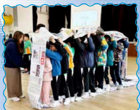
同學們參與歷奇訓練，發揮團隊精神。