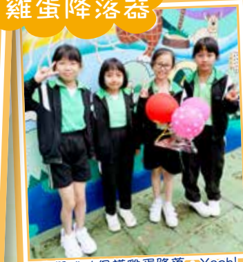
我們成功保護雞蛋降落，Yeah!