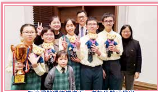
在這個難得的機會下，本校獲獎同學與保安局局長 鄧炳強先生合影留念。