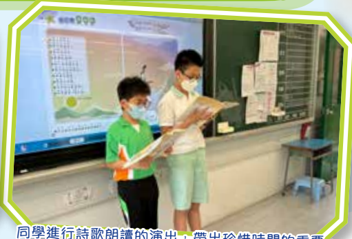
同學進行詩歌朗讀的演出，帶出珍惜時間的重要。