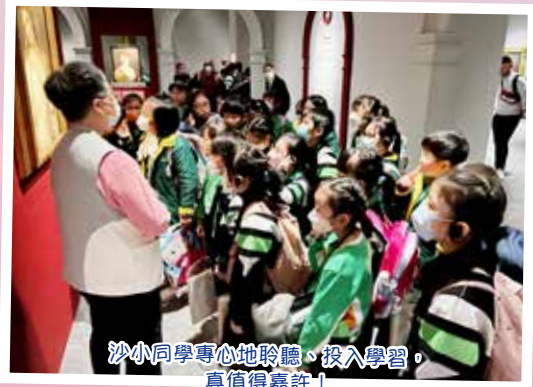
沙小同學專心地聆聽、投入學習，真值得嘉許！