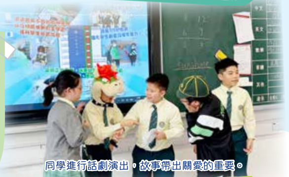
同學進行話劇演出，故事帶出關愛的重要。

在3、4月時，普通話科進行了才藝表演，表演是培養學生正面的價值觀，如自律、尊重他人、關愛、喜愛學習及欣賞中華文化或守法守規的態度。學生可表演如話劇、角色扮演、魔術表演、朗讀故事、唱歌、猜謎語等多元化的活動，同學們積極參與，認真演出，值得欣賞。