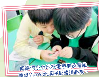
同學們小心地把電燈泡及電風扇跟Micro:bit擴展板連接起來。