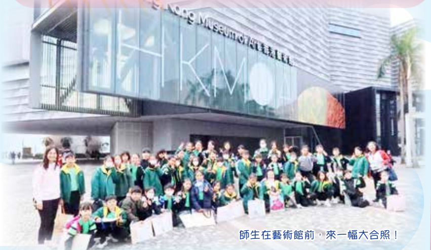
師生在藝術館前，來一幅大合照！