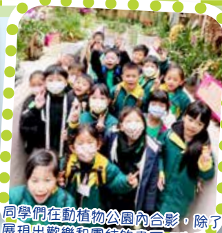
同學們在動植物公園內合影，除了展現出歡樂和團結的畫面，也展現了他們對自然景觀的熱愛和欣賞。