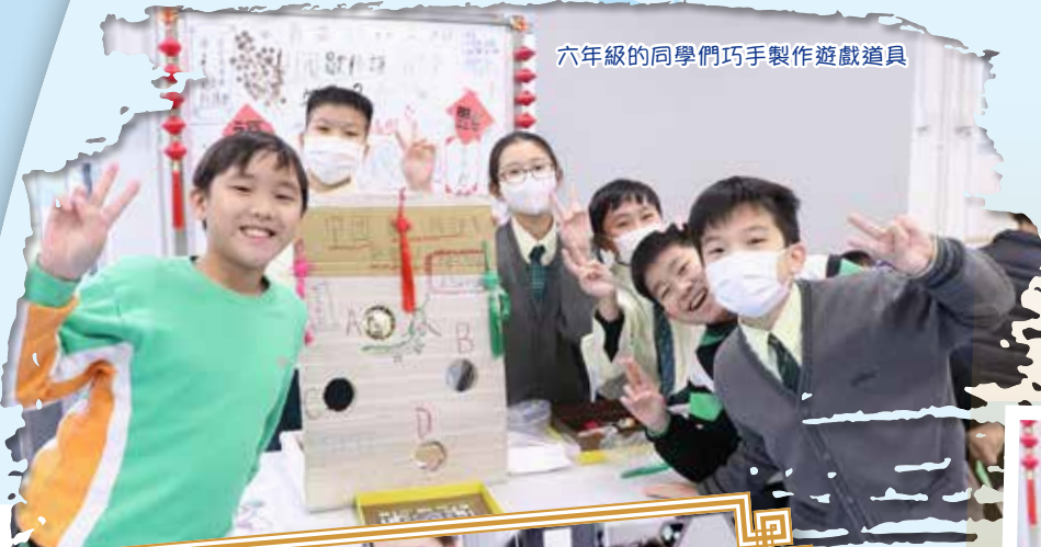
六年級的同學們巧手製作遊戲道具