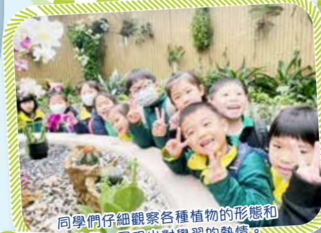
同學們仔細觀察各種植物的形態和特徵，展現出對學習的熱情。

一年級同學於三月一日到香港動植物公園進行戶外參觀活動，感受大自然的奧妙。透過參觀園內的各種設施，同學們學習到對動物、植物、生物多樣性以及環境的重要性，並且培養了珍惜自然資源的意識。