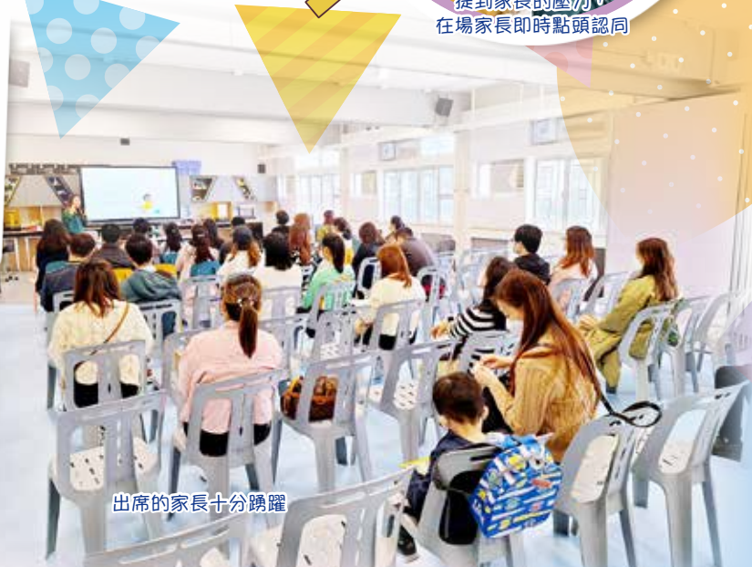
出席的家長十分踴躍