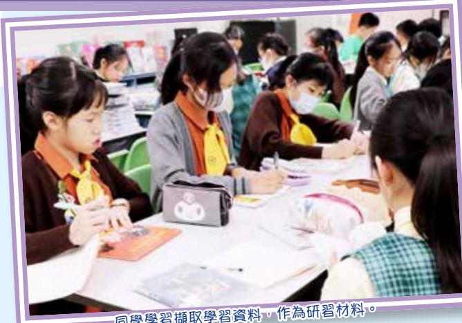
同學學習擷取學習資料，作為研習材料。