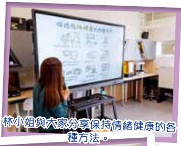
林小姐與大家分享保持情緒健康的各種方法。