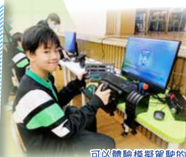
可以體驗模擬駕駛的樂趣，大家都份外投入！