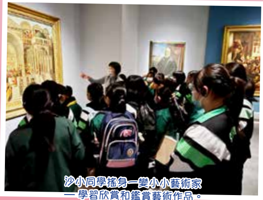
沙小同學搖身一變小小藝術家——學習欣賞和鑑賞藝術作品。