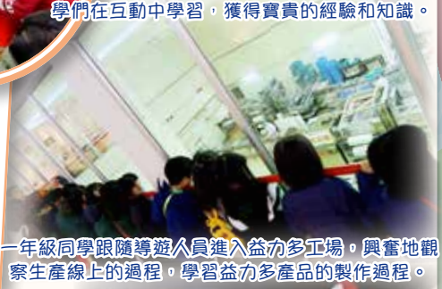
一年級同學跟隨導遊人員進入益力多工場，興奮地觀察生產線上的過程，學習益力多產品的製作過程。