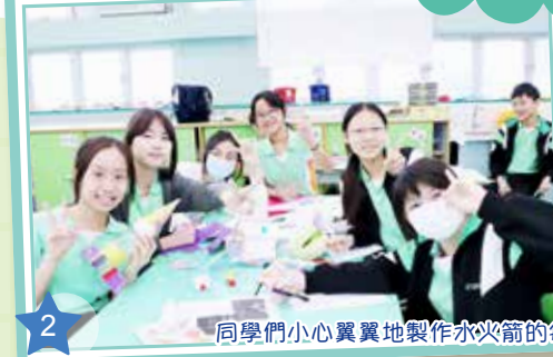
同學們小心翼翼地製作水火箭的每一部分，希望水火箭能成功升空！