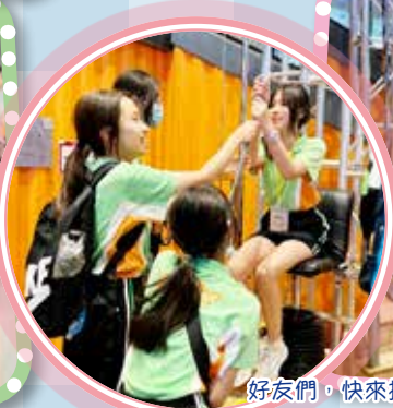
好友們，快來把我往上拉...