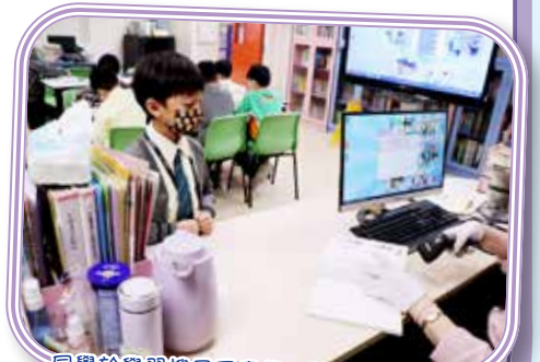
同學於學習搜尋圖書後，即時借閱圖書。