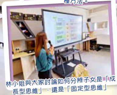
林小姐與大家討論如何分辨子女是「成長型思維」，還是「固定型思維」