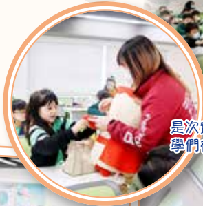
是次實地參觀活動充滿活力和教育意義，讓同學們在互動中學習，獲得寶貴的經驗和知識。

益力多乳品廠為一歷史悠久的工廠，本校特別安排一年級同學於1月23日和1月29日到「益力多工場」參觀，讓學生認識益力多產品的成份及生產程序，藉此增廣見聞，了解食品對健康的影響，增加生活經驗。