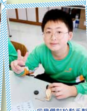
同學們對於動手製作的機械人十分有興趣！