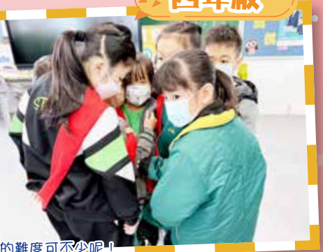
在「地雷陣」活動中，同學們利用規定的資源，以有效的溝通完成任務，這活動的難度可不少呢！