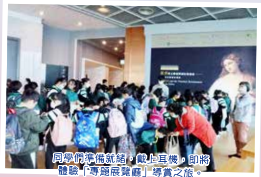
同學們準備就緒，戴上耳機，即將體驗「專題展覽廳」導賞之旅。

是次專題展覽名為「提香與文藝復興威尼斯畫派——烏菲茲美術館珍藏展」，此活動目的是讓學生探索首次在香港展出的文藝復興時期的作品，當中以知名的藝術家提香的作品為主，以及其他威尼斯藝術大師的作品。同時透過導賞和持續提問，讓學生探視文藝復興時期威尼斯的畫派，從中欣賞畫作的色彩和背後的故事和情感。