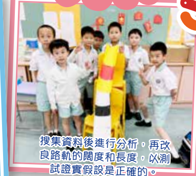
搜集資料後進行分析，再改良路軌的闊度和長度，以測試證實假設是正確的。