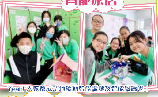
Yeah! 大家都成功地啟動智能電燈及智能風扇呢!