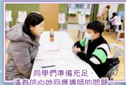
同學們準備充足，滿有信心地回應導師的問題。