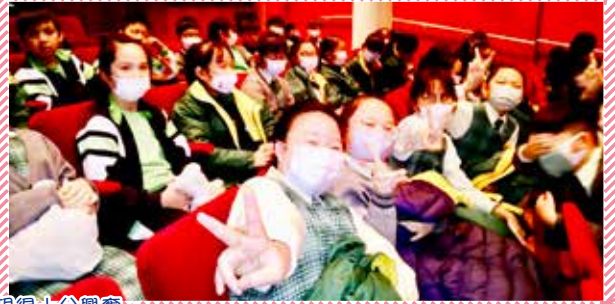
音樂會前，各同學表現得十分興奮。