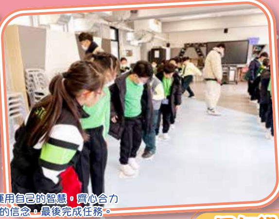
在「過河」活動中，同學們在特定的規則下，運用自己的智慧，齊心合力克服困難。雖然經歷多次失敗，憑着大家堅守的信念，最後完成任務。