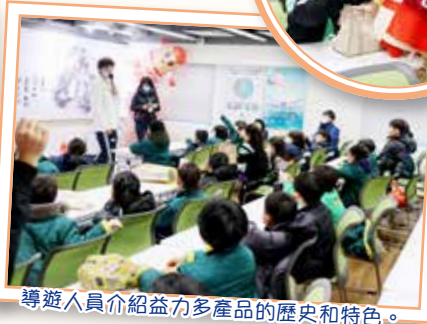
導遊人員介紹益力多產品的歷史和特色。