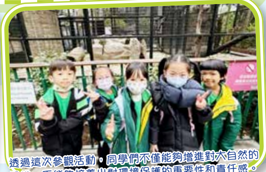
透過這次參觀活動，同學們不僅能夠增進對大自然的認識，更能夠培養出對環境保護的重要性和責任感。