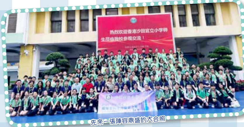
先來一張陣容鼎盛的大合照

是次交流主題環繞科技探討，姊妹學校細意安排剛獲卓越獎的年輕老師，上了一節精彩的探究課，名為「以靜制動的神力」。在台上，沙小派出的二十位同學跟內地同學協力進行實驗探究活動；在台下，沙小同學也分組進行實驗。無論台上台下，同學互動不遑多讓，好不熱鬧！沙小同學親身體驗內地的學習後，便一嚐鵬城粵宴，飯後隨即參觀龍崗區科技館，瞭解國情和擴闊視野外，更全方位認識國家的科技領域及未來國家的科技發展方向，活動新穎吸引，令同學幾乎樂而忘返呢！