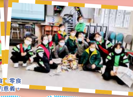
在「零食塔」活動中，同學們需於限時內製作兩個塔，塔上擺放零食，零食最後會送給同學。他們從分享中領略「團結精神」和「樂意聆聽」的意義。