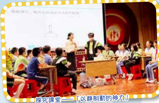
探究課堂——「以靜制動的神力」