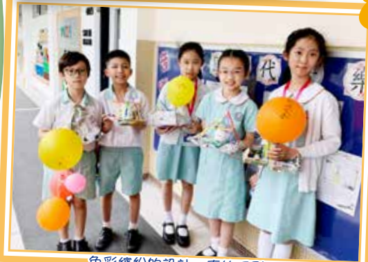
色彩繽紛的設計，真的吸引！