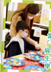
當日禮堂設有「學生學習成果展」，家長和學生都細心欣賞同學的作品和比賽成果。